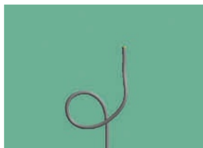
ScopeGuide 3 Bild

Hinweis: Die Bilder in der obigen Darstellung dienen lediglich der Illustration