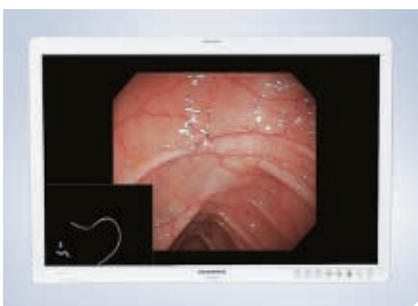
Bild im Bild

ScopeGuide 3 zeigt Ihnen die Form und Lage des Koloskops dreidimensional und vor allem in Echtzeit. Eine Röntgenkontrolle wird überflüssig, was die Strahlenbelastung für Patienten und Mitarbeiter verringert. Darüber hinaus sind bestehende und entstehende Schlingen früh zu erkennen, und Sie bekommen ein besseres Gefühl dafür, welche Manöver erforderlich sind, um diese zu begradigen. Das ScopeGuide 3 Bild und das endoskopische Bild können auf demselben Monitor betrachtet (z. B. OEV-261H) werden.