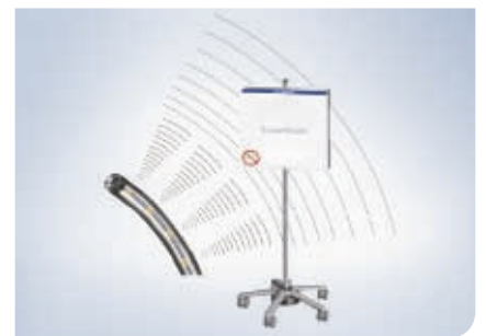
Integrierte elektromagnetische Spulen

In das Einführteil des Koloskops integrierte elektromagnetische Spulen erzeugen ein schwaches, gepulstes Magnetfeld, das von der Antenne erkannt wird. Mit Hilfe der magnetischen Pulse wird die genaue Form und Lage des Einführteils berechnet und ein dreidimensionales Bild auf dem Monitor erzeugt.